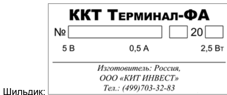
Рисунок 1. Шильдик.