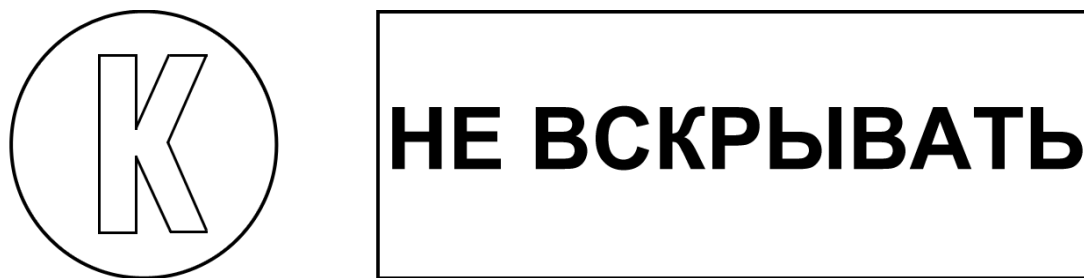
Рисунок 2. Образцы заводских пломб.